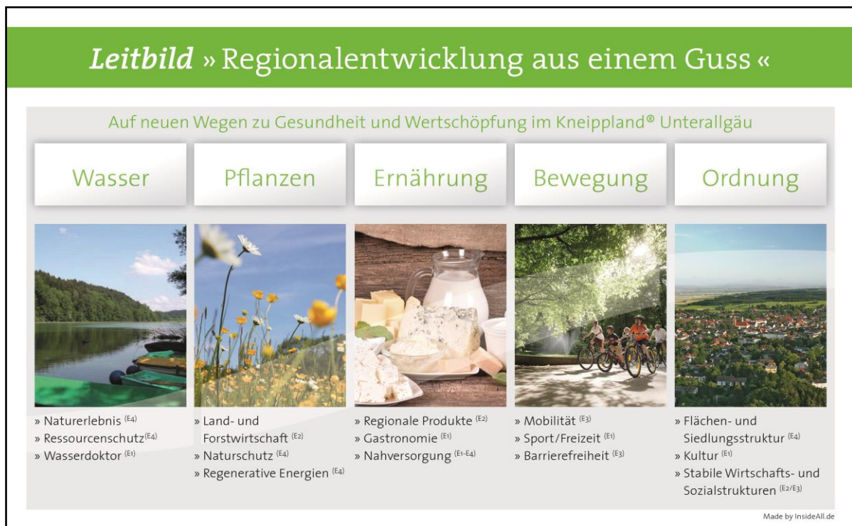
Abb. 4: Leitbild „Regionalentwicklung aus einem Guss“ der LAG Kneippland® Unterallgäu mit Bezug zu den Entwicklungszielen E1-E4

integrativen und sektorenübergreifenden Regionalentwicklung im Unterallgäu übertragen werden und sich im aktuellen Leitbild „Regionalentwicklung aus einem Guss“ widerspiegeln.