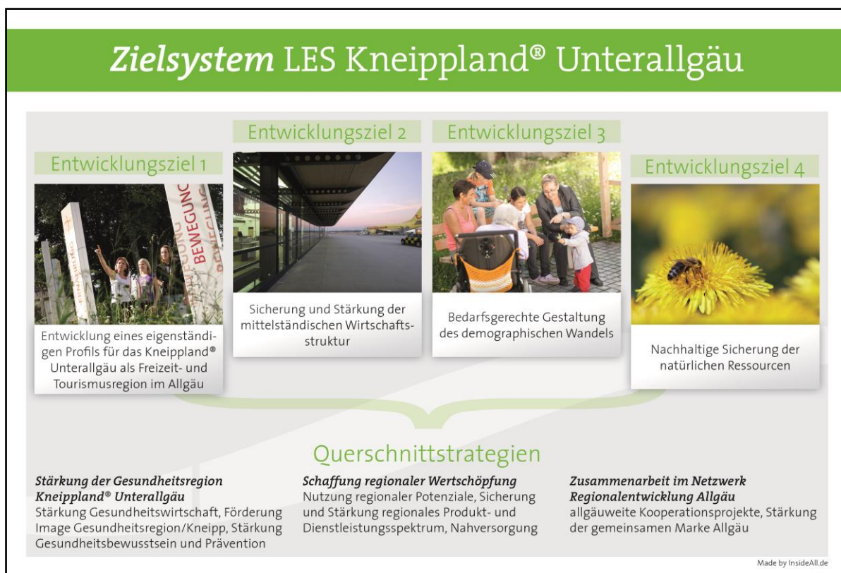
Abb. 3: Zielsystem Lokale Entwicklungsstrategie Kneippland® Unterallgäu