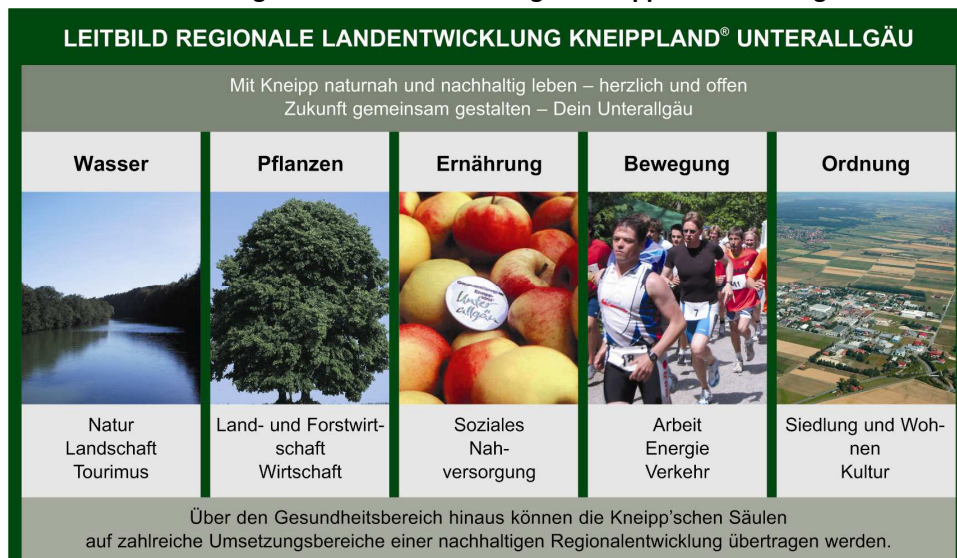
Abb. 4: Leitbild der Regionalen Landentwicklung im Kneippland® Unterallgäu