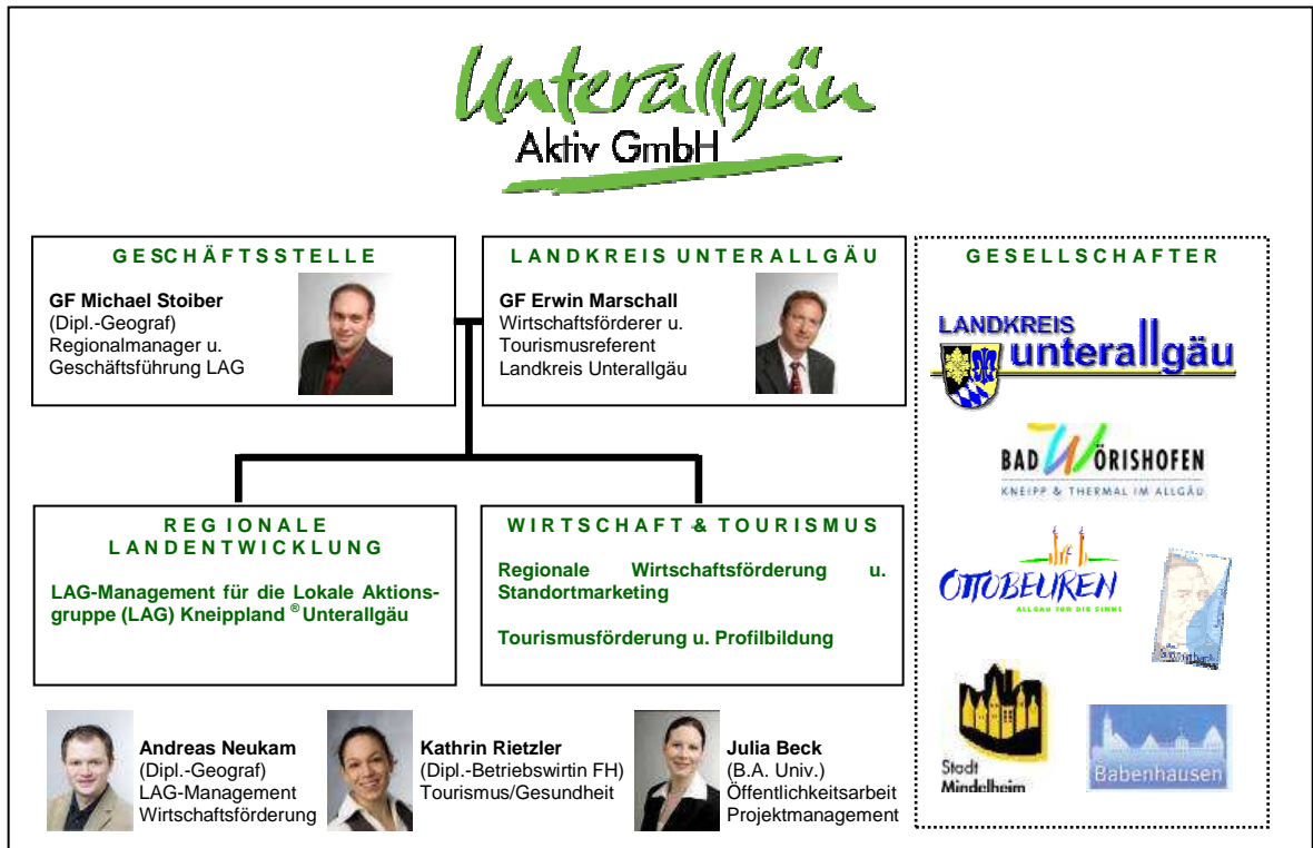
Abb. 1: Organisationsstruktur der Unterallgäu Aktiv GmbH

Die Organisationsstruktur der Unterallgäu Aktiv GmbH zeigt sich wie folgt: Das Team setzt sich aus zwei Geschäftsführern (davon ein Regionalmanager) und drei Mitarbeitern zusammen. Zusätzlich wird sie bedarfsorientiert von freien Mitarbeitern und Praktikanten unterstützt.