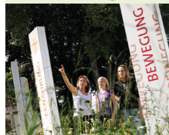
Entwicklung eines eigenständigen Profils für das Kneippland® Unterallgäu als Freizeit- und Tourismusregion im Allgäu