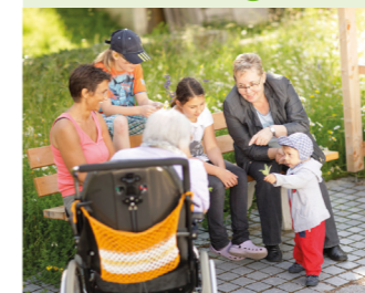
Bedarfsgerechte Gestaltung des demographischen Wandels